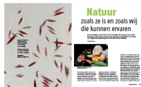
herman de vries