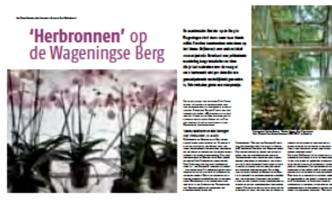
Beelden op de Berg