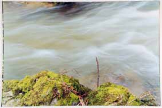
Fragmenten uit: Perches (2001)