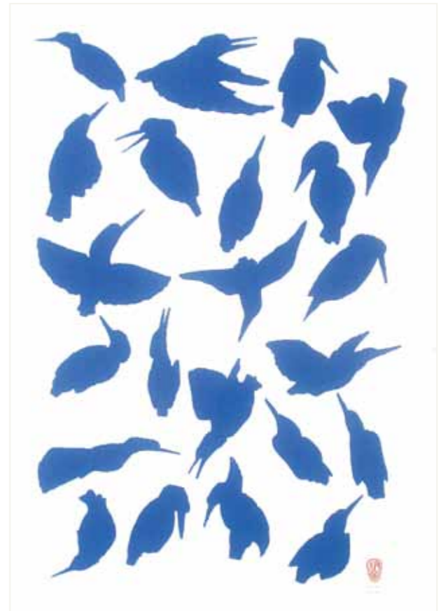
22 ijsvogels, 2000, zeefdruk, 70 x 50 cm.

Waanders trachtte het vogeltje te leren kennen tot op het bot, in de overtuiging zo vanzelf een volgende ontmoeting tegemoet te gaan. Hij kende alle geluiden, vliegbewegingen, verblijfplaatsen, prooien en vijanden en de verschillende benamingen wereldwijd. Waanders schreef, tekende, maakte collages en zeefdrukken, maar bovenal aquarellen en stempelwerken. Door zich te beperken tot 'slechts' één onderwerp, wist Hans Waanders bovendien zijn verbeeldingskracht keer op keer uit te dagen. Tot in 2001 – toen was zijn lichaam moegestreden. Het lijkt alsof je dat terug kunt zien in de ontwikkeling van zijn oeuvre. In een van zijn laatste werken had Waanders de ijsvogel zelf niet eens meer nodig. Tijdens wandelingen langs beken, stroompjes en rivieren in Nederland, Frankrijk, Duitsland, België, Engeland en