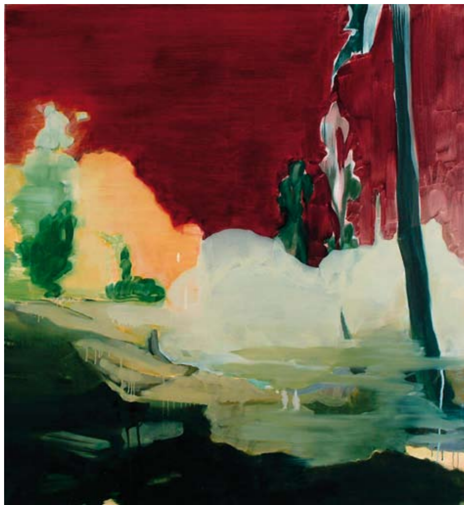
Bosbrand 2006, 130 x 120 cm olieverf op doek