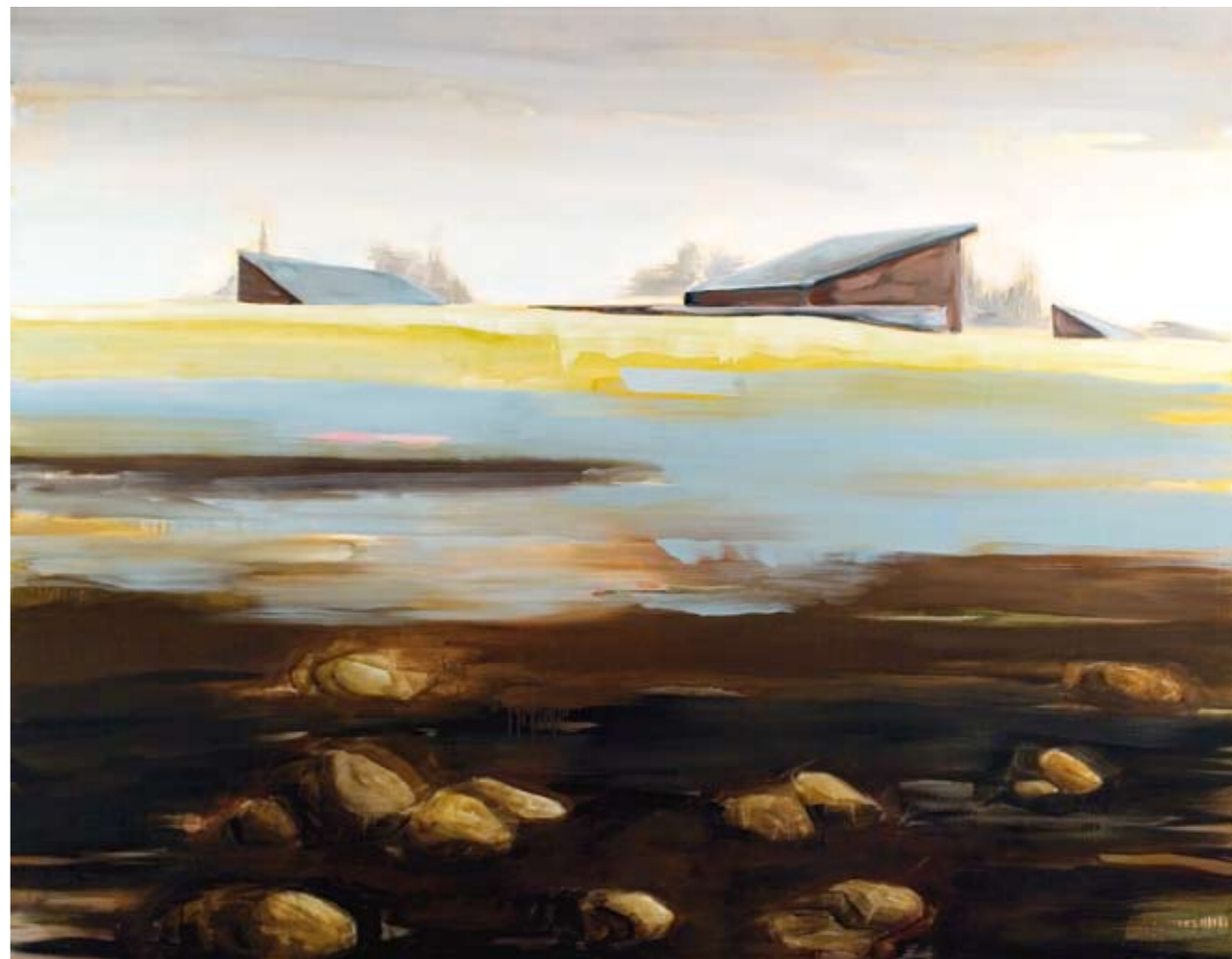
Zonder titel 2005, 130 x 170 cm olieverf op doek