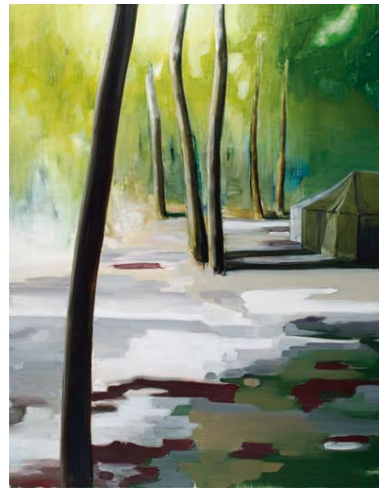
Camouflage 2005, 180 x 140cm olieverf en lak op doek