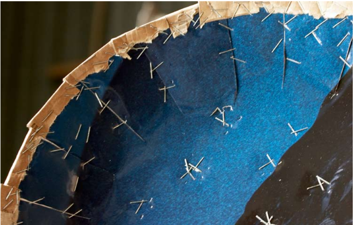
Detail kartonnen schotel, Blauwe Lucht, Toch Sterren, diameter 38 cm.

Productie Winja Stappers Tekst Jack Meijers