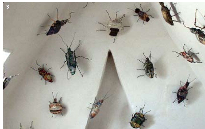
1 + 2 Met een eenvoudige handnietmachine werkt Van Leeuwen aan twee vazen. 3 Fragment van een project voor Jardin d'Amis 2004 in Amersfoort, Kaalgevreten tuin met kevers, 200 x 300 x 250 cm. Rechterpagina Detail van een kan met hondendeksel, 70 x 45 x 30 cm.