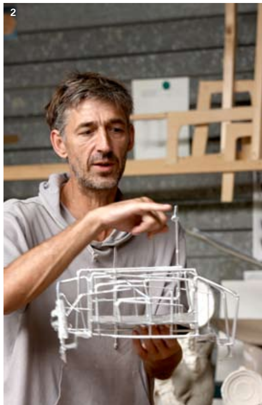
1 Het Watersnoodrampkastje combineert karton met beelden uit het rampjaar 1953. 2 Schetsontwerp met satéprikkers en rietjes voor Oude Eemloopbrug. Rechterpagina Het project Oude Eemloopbrug (2008) markeert in Amersfoort de plek waar ooit een zijtak van de Eem de stad binnenkwam. De sculptuur in het Zocherplantsoen is samengesteld uit ijzeren handpompen, een douche, kranen, koppelingen en buizen.