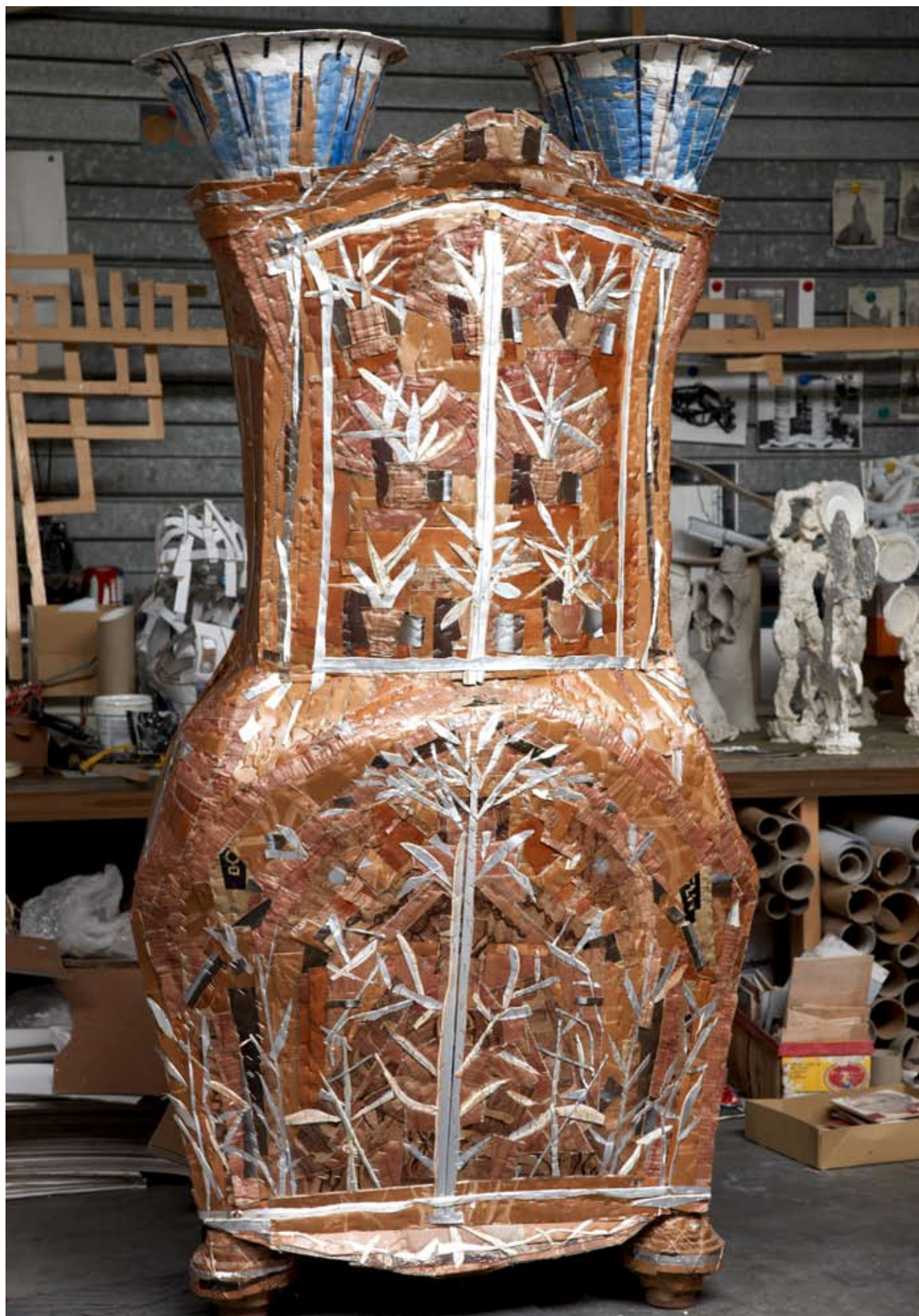
Grote kast Potplanten en Wilde Planten, 215 x 115 x 45 cm.